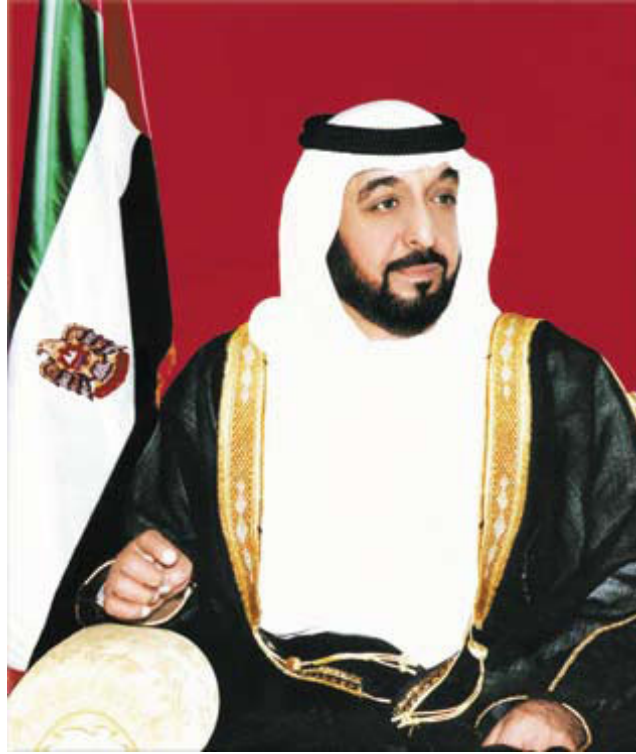
صاحب السمو الشيخ خليفة بن زايد آل نهيان رئيس دولة الإمارات العربية المتحدة