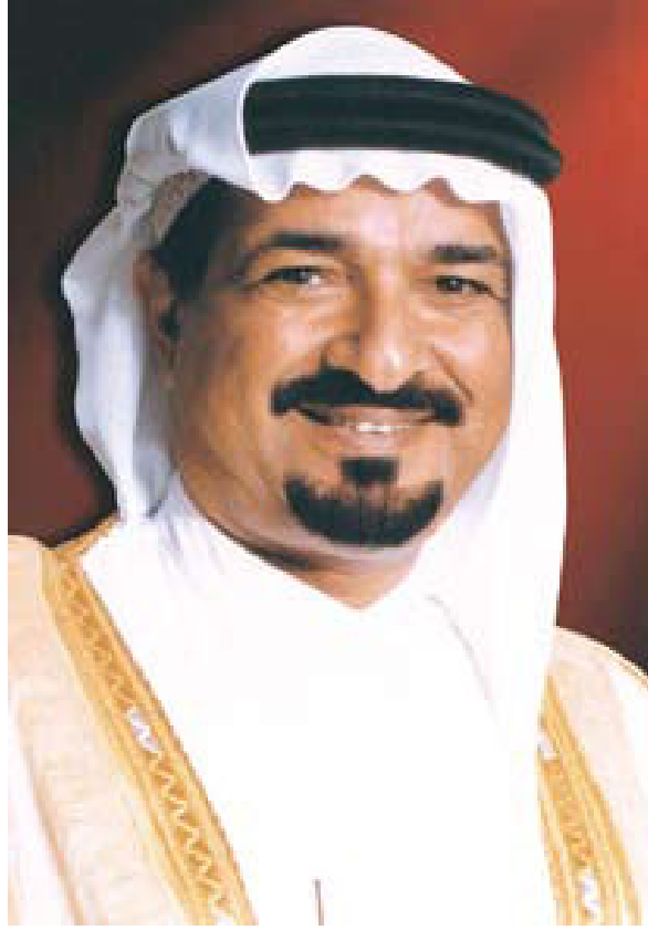
صاحب السمو الشيخ حميد بن راشد النعيمي عضو المجلس الأعلى - حاكم عجمان رئيس مجلس أمناء جامعة عجمان