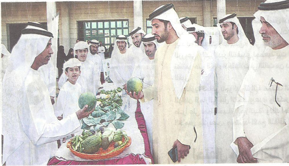
راشد بن حميد خلال تفقدته للمعرض الزراعي للساحب للجائزة

على تعريف الجمهور بمنتجاتهم الزراعية وتحفيز المزارعين على الابتكار والإبداع في الإنتاج الزراعي مشيداً بجهود طلبة كلية الهندسة المعمارية بجامعة عجمان على تصاميمهم الهندسية الإبداعية المبتكرة.