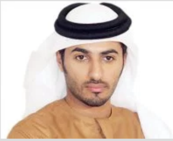
الشيخ راشد بن حميد النعيمي رئيس دائرة البلدية والتخطيط في عجمان

بواسطة آراء الإخبارية / بتاريخ 24 نوفمبر، 2016 في 7:00 م /