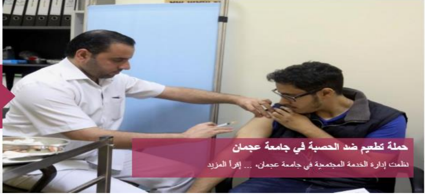
حملة تطعيم ضد الحصبة في جامعة عجمان نظمت إدارة الخدمة المجتمعية في جامعة عجمان، ... إقرأ المزيد