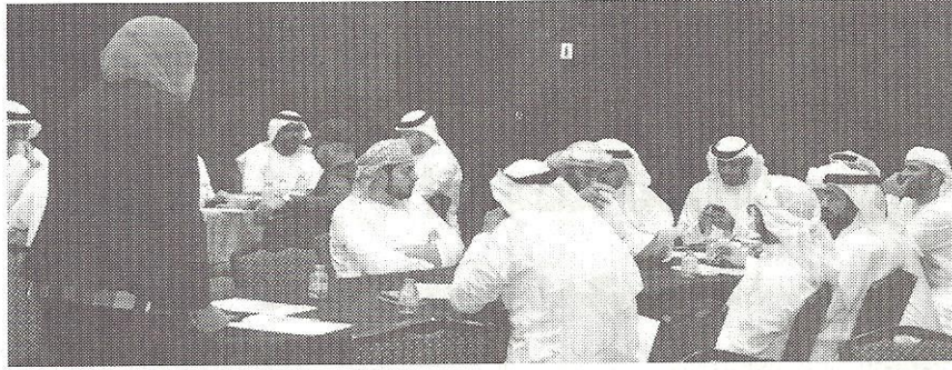
جانب من الدورة